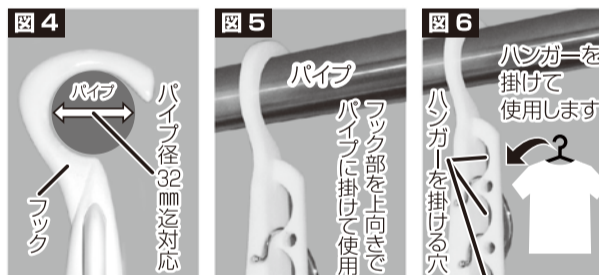
パイプ径 32mm 迄対応

フック部分を上向きでパイプに掛けて使用して下さい。※なげしでの使用とは上下向きが逆になります。