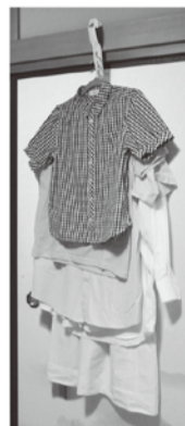
衣類は重なり合った状態で収納されます。

2WAYハンガーフックは「①なげしに掛けて、日頃良くお召しになれる衣類の一時掛け」と「②クローゼット・タンス内のパイプに掛けて、収納スペースを有効活用した収納」の2通り(2WAY)ができる収納便利用品です。衣類をタテに重ねて吊す事で少ないスペースで収納できるのでなげしに掛けて収納も室内で邪魔にならず、クローゼット・タンス内では、下部のスペースも有効活用出来ます。