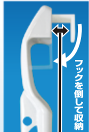
壁面に垂直に吊るす